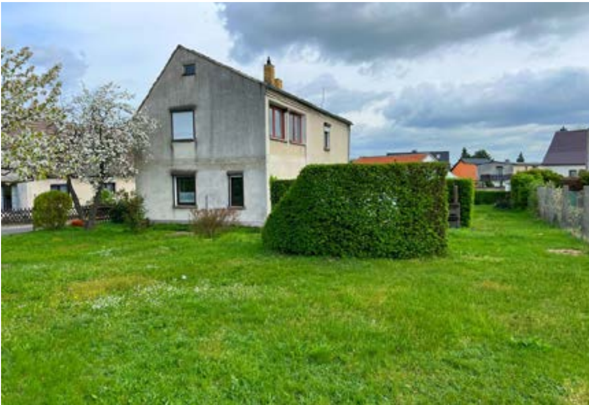
Objektansicht im Garten